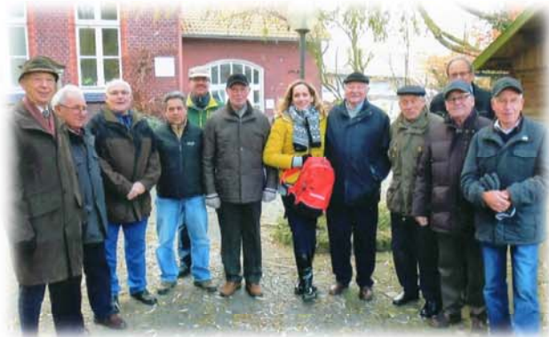
Tamina Kallert am 07.12.2014 mit dem Krippenbauersteam

Der überdimensionale Adventskalender begrüßt die Besucher an der Petronilla Kirche.